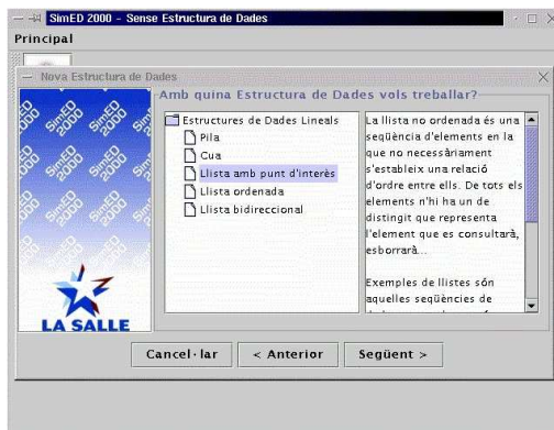
Figura 1. Pantalla principal del simulador.

Para reforzar la comprensión de las estructuras lineales de datos, que se consideran como temario imprescindible de la asignatura, se ha llevado a cabo el diseño y desarrollo de una aplicación destinada a este fin [7]. La figura 1 muestra la pantalla principal del simulador. La figura 2 muestra un ejemplo de simulación para una estructura de datos, en esta figura se pueden observar los diferentes botones de ejecución para realizar diversos movimientos sobre la estructura de datos.